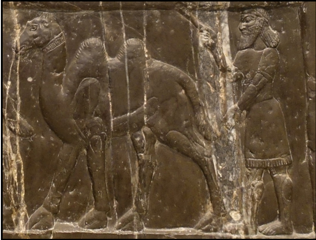
Teve ábrázolása III. Salmanasszár 'Fekete obelisztk' -jén (British Museum)

A Biblia prófétikusan említi őket, mint olyan népet, amelyet az Isten a végső időkben összegyűjt a nagy evangéliumhirdetés idején. „ A tevék sokasága elborít, Midján és Éfa tevecsikói, mind Sebából jönnek, aranyat és tömjént hoznak, és az Úr dicséreteit hirdetik. Kédár minden juhait hozzád gyűlnek, Nebajóth kosai néked szolgálnak, felmennek kedvem szerint oltáromra, és dicsőségem házáat megdicsőítem. ” Ésa. 60,6-7