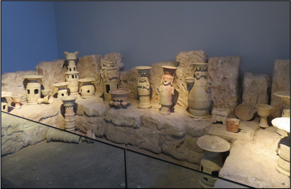
Rekonstruált Edomita szentély rituális edényekkel (Kr. e. késő 7. korai 6. század, cserépedény és kő) (Jeruzsálem, Izrael Múzeum)